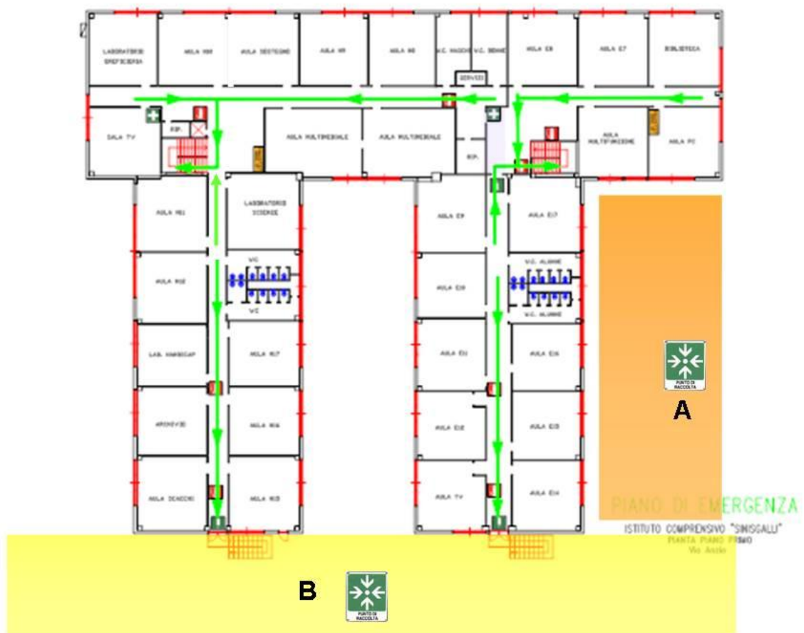
PIANTA PRIMO PIANO: SEDE VIA ANZIO